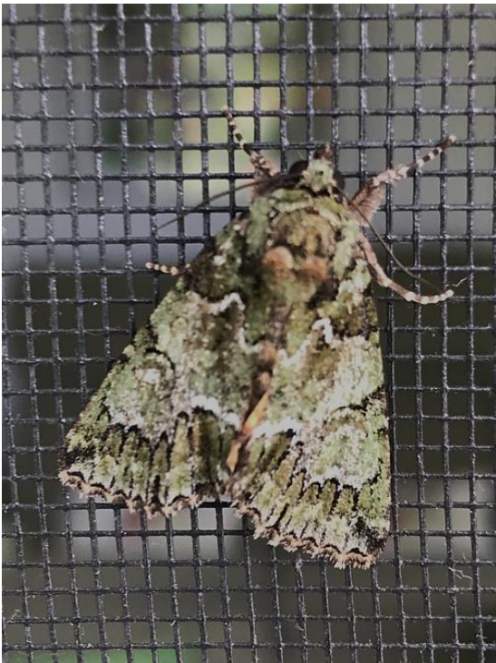
Abb. 3: Polyphaenis sericata (ESPER, [1787]), 25.07.2024 Mittweida, Grundstück, Terrassentür

Der Fundort ist den Literaturangaben zufolge typisch. In Ortsrandlage befinden sich bebaute Grundstücke mit reichlich vorhandenen Liguster-(und Flieder-)hecken in natürlicher bis naturnaher Umgebung. Seit Jahren fliegt hier auch regelmäßig die Spanische Flagge Euplagia quadripunctaria (PODA, 1761).